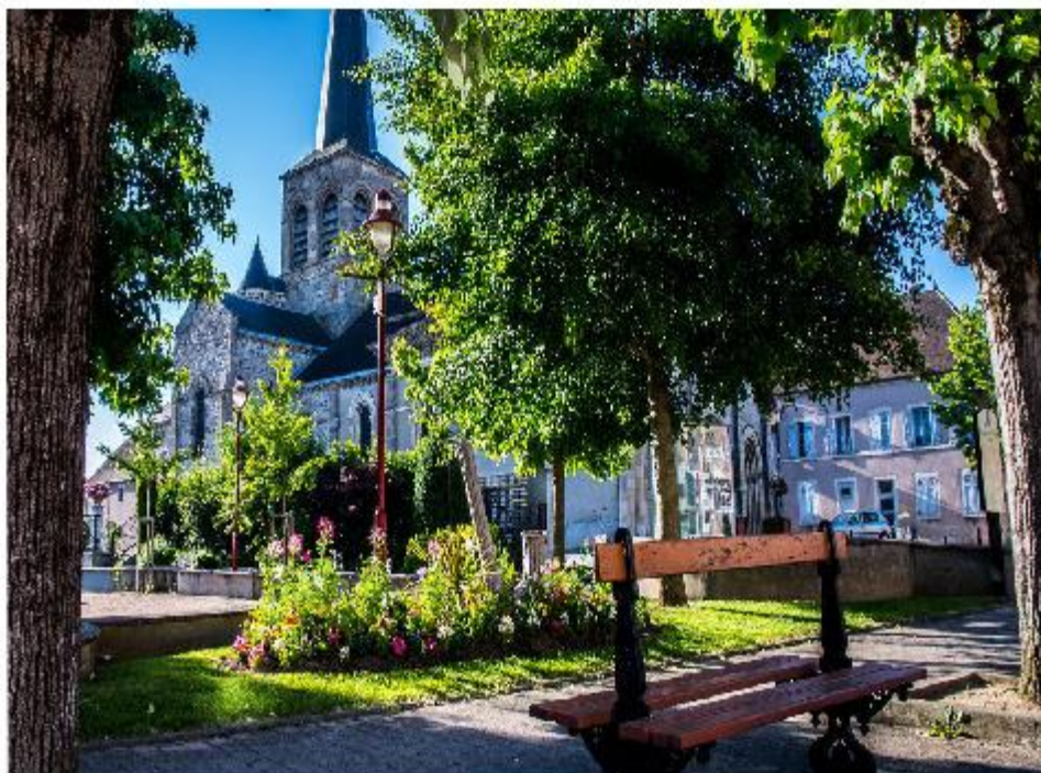
Place Bacchus à Domérat